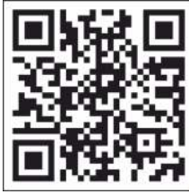
Scansiona il QR CODE

Sul sito www.imola.it sono disponibili tutti gli eventi, aggiornati e dettagliati. Comodo e consultabile anche da smartphone.